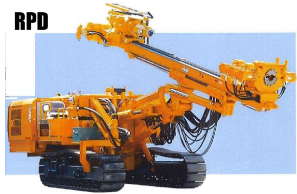
RPD-160C / RPD-160C-10T